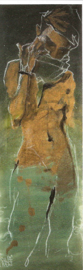
5 - "AUTORITRATTO" 37x112 tecnica mista su pannello in legno certificato anno 2013